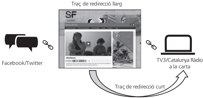
Figura 3. Recorreguts de l'usuari cap al visionament del documental. Traç llarg: xarxes socials + web + visionament / Traç curt: web + visionament